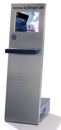
Individuelle Gehäuse für Multimedia-Terminals