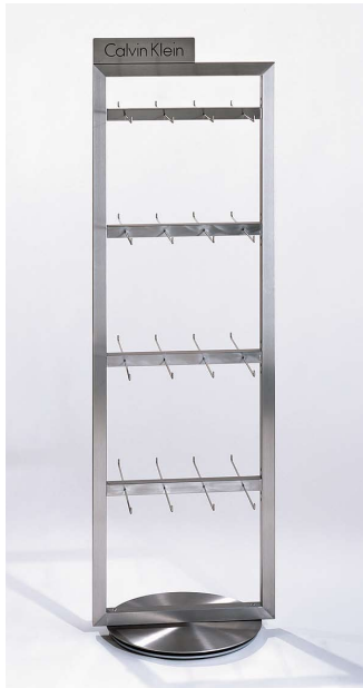
Warenträger für Kleintextilien