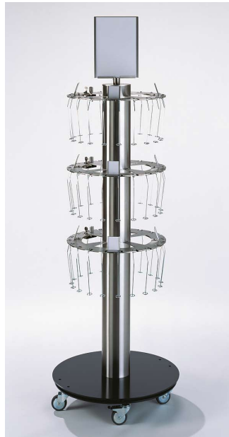
Geldbörsen-Präsentier mit Diebstahlschutz