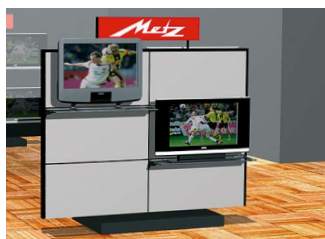
Shopkonzept Metz LCD-TV

Displays von Kollinger - für die wirkungsvolle Inszenierung Ihrer Marke am POS. Attraktiv. Funktional. Kosteneffizient.